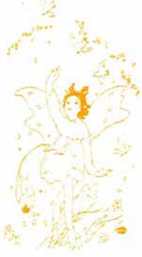
加藤まさで「合歡の挿籃」より

○お断り○ 本の状態について 本書は刊行年が古いため、一部に函・表紙・小口等に経年劣化が見られますが、本文は概して良好で閲覧に支障ありません。