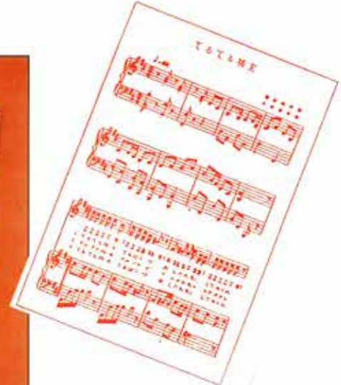
浅原鏡村「青ぞらのとり」より

「東方の旭日と、桜の国に生れた、わが少年のために、愛と熱とをもつて歌った詩です。」と巻頭言にあるごとく、少年の雄心を鼓舞する傑作童謡を集大成。「飛行文豪タヌ子才を讃ふ詩」「熱血児高山彦九郎」など快吟六〇余編を収める。