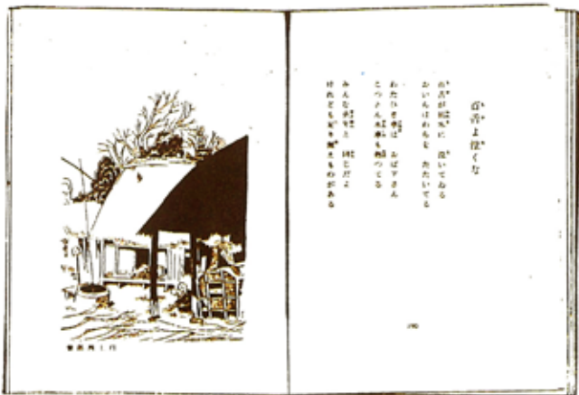
サトウ・ハチロー「僕等の詩集」より

「金魚の狂宴」「お山のお猿」など大正八年から昭和四年まで一〇年間における成果を集大成。巻頭には人口に膾炙した「浜千鳥」(弘田龍太郎作曲)や江沢清太郎・草川信による五編の曲譜を掲げる。