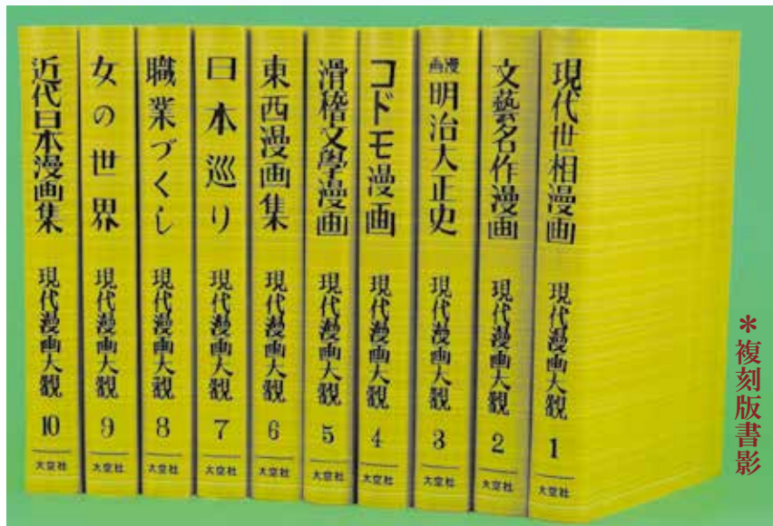
A5判・上製・総約3000頁(別冊・並製・約120頁)

原本書影(カラー) 解説II『現代漫画大観』全10編の持つ意味 (特色と刊行の背景・編集のポイント) 清水 勲(漫画・風刺画研究家) 刊行の資料/全10編総目次/作家別作品一覧