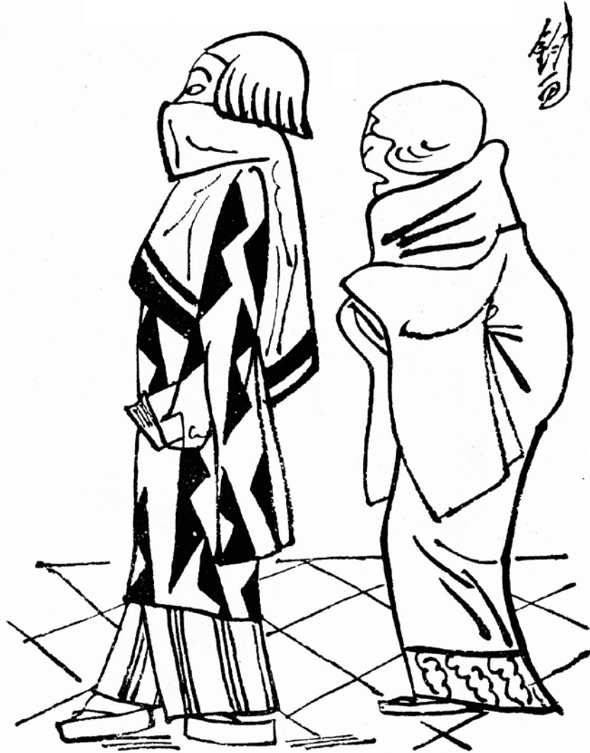
第1編「現代世相漫画」より