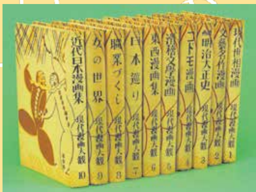
*原本書影 (昭和3年、中央美術社刊)

哄笑 爆笑 大笑 微笑 微苦笑 薄笑い 含み笑い 忍び笑い ほくそ笑み 嘲笑 冷笑 失笑 喜怒哀楽 冗談 抱腹絶倒 感動 教訓 阿諛 迎合 追従 憤慨 糾弾 寓意 アイロニー 皮肉 諧謔 諷刺——